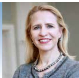
Dr. Aurelia Frick Regierungsrätin des Fürstentums Liechtenstein

„Chemie ist Innovation“ ist das Motto für den europäischen Kongress der Chemielehrpersonen, welcher 2017 in Liechtenstein stattfindet. Mit diesem Anlass an der Universität Liechtenstein haben Lehrpersonen aus den naturwissenschaftlichen Fächern die einmalige Gelegenheit, sich mit äusserst kompetenten und renommierten Referentinnen und Referenten auszutauschen.