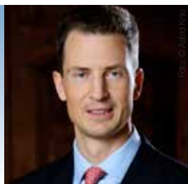
S.D. Erbprinz Alois von und zu Liechtenstein

Es freut mich ausserordentlich, dass der 14. Europäische Kongress der Chemielehrer/innen in Liechtenstein stattfindet. Das Motto des diesjährigen Kongresses lautet „Chemie ist Innovation“ und „Innovation ist Chemie“. Gerade für einen Staat wie Liechtenstein und seinem breit diversifizierten Wirtschaftsstandort mit vielen Technologieführern und einem hohem Lohnniveau sind Innovationsbereitschaft und das ständige Bemühen um technischen Fortschritt essentiell. In den letzten Jahren sah sich Liechtenstein mit einem schwierigen wirtschaftlichen Umfeld konfrontiert. Nicht zuletzt