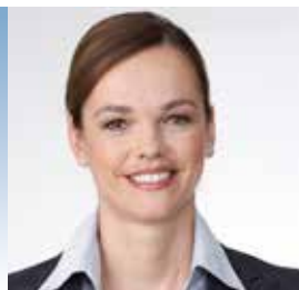
Bundesministerin Dr. Sonja Hammerschmid

Mit dem 14. Europäischen Chemielehrer/innenkongress setzt der Verband der Chemielehrer/innen Österreichs ein deutliches und sehr positives Zeichen in der österreichischen naturwissenschaftlichen Fortbildungslandschaft. Der Europäische Chemielehrer/innenkongress bietet die Möglichkeit, sich über die Staats- und Landesgrenzen hinweg zu vernetzen und auszutauschen – der heurige Tagungsort Vaduz im benachbarten Liechtenstein bildet dazu das geeignete Umfeld.